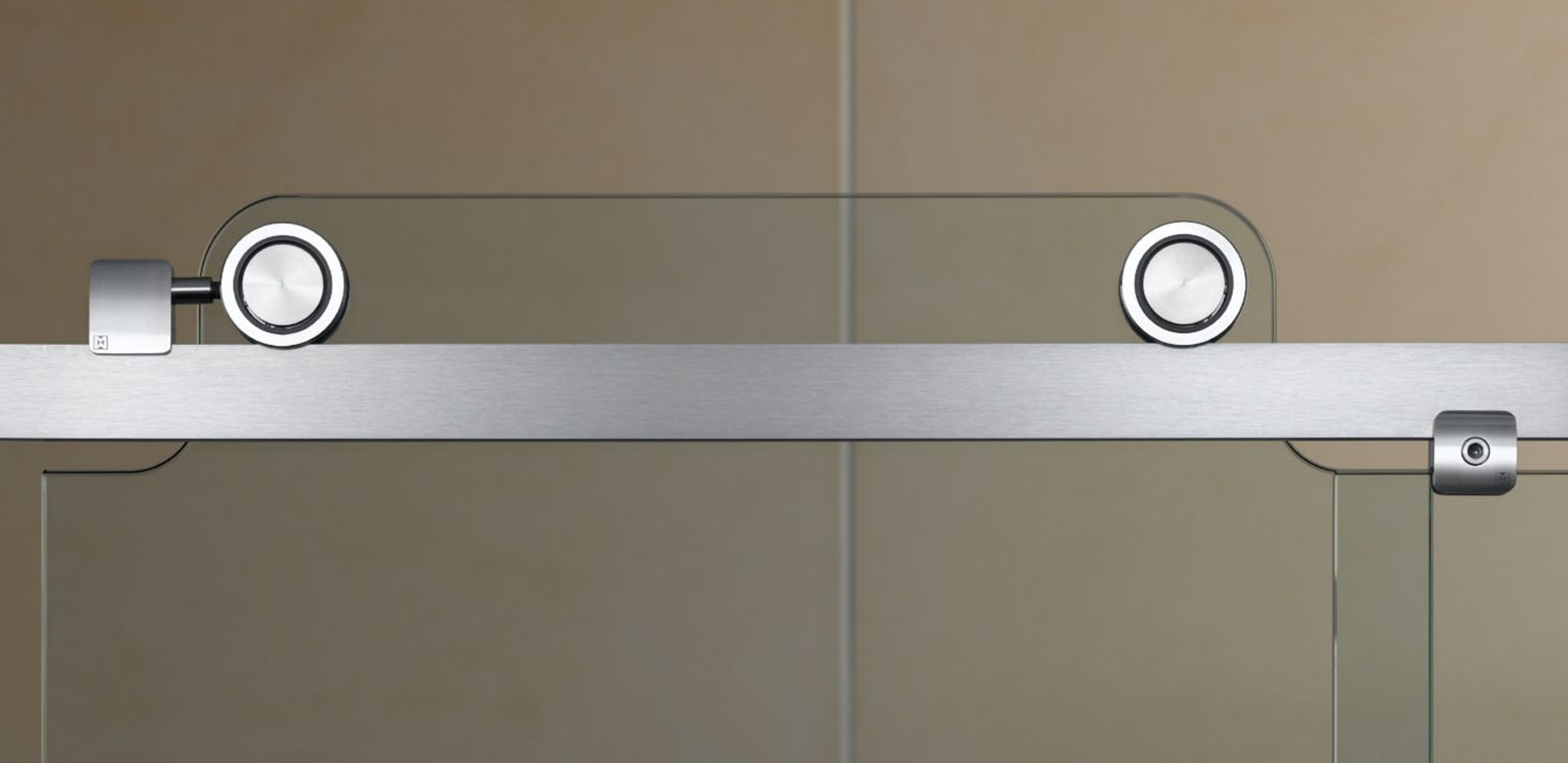
Duschsystem Claro DU.1014