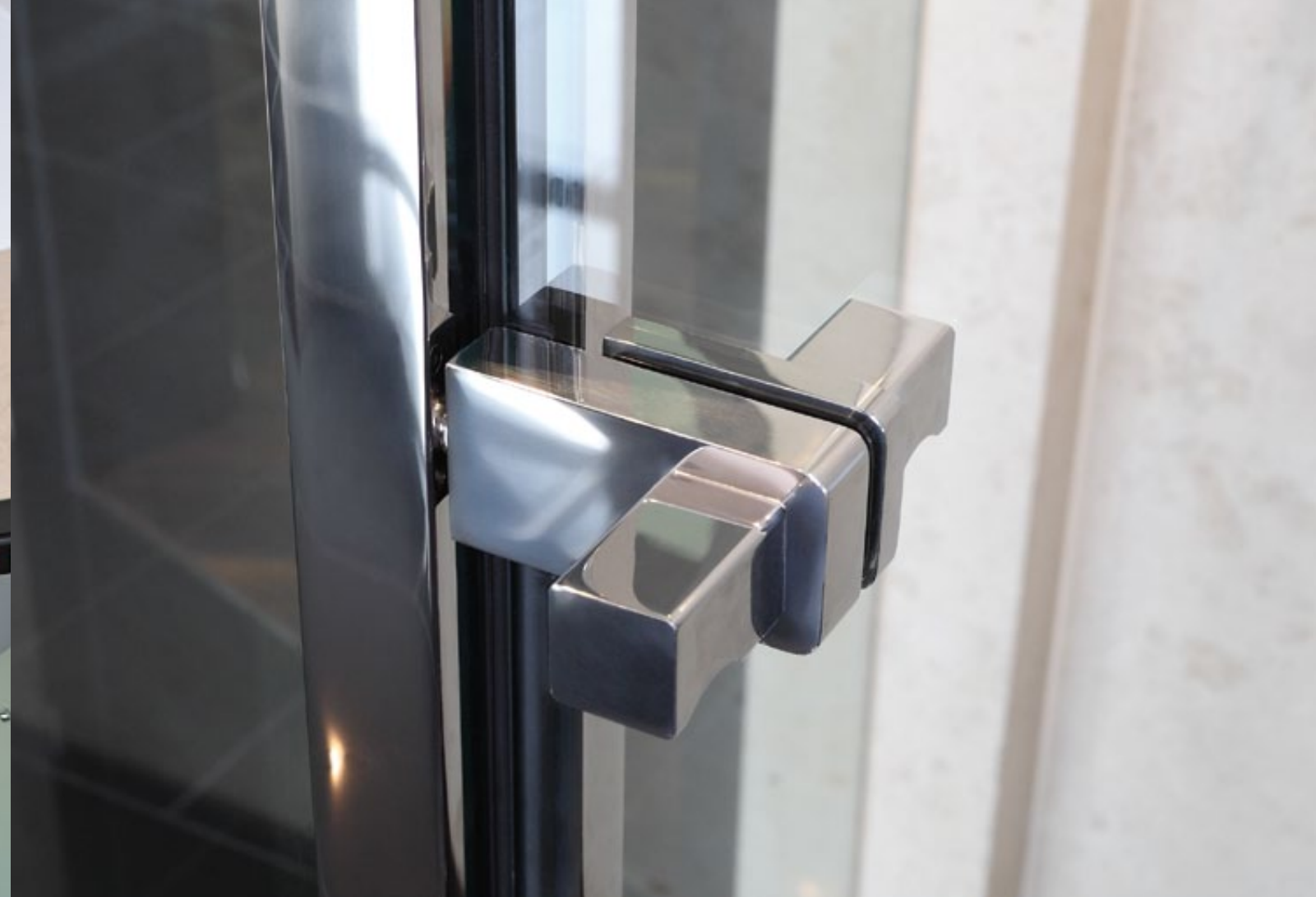
Duschsystem Akzent poliert, shower system Akzent polished