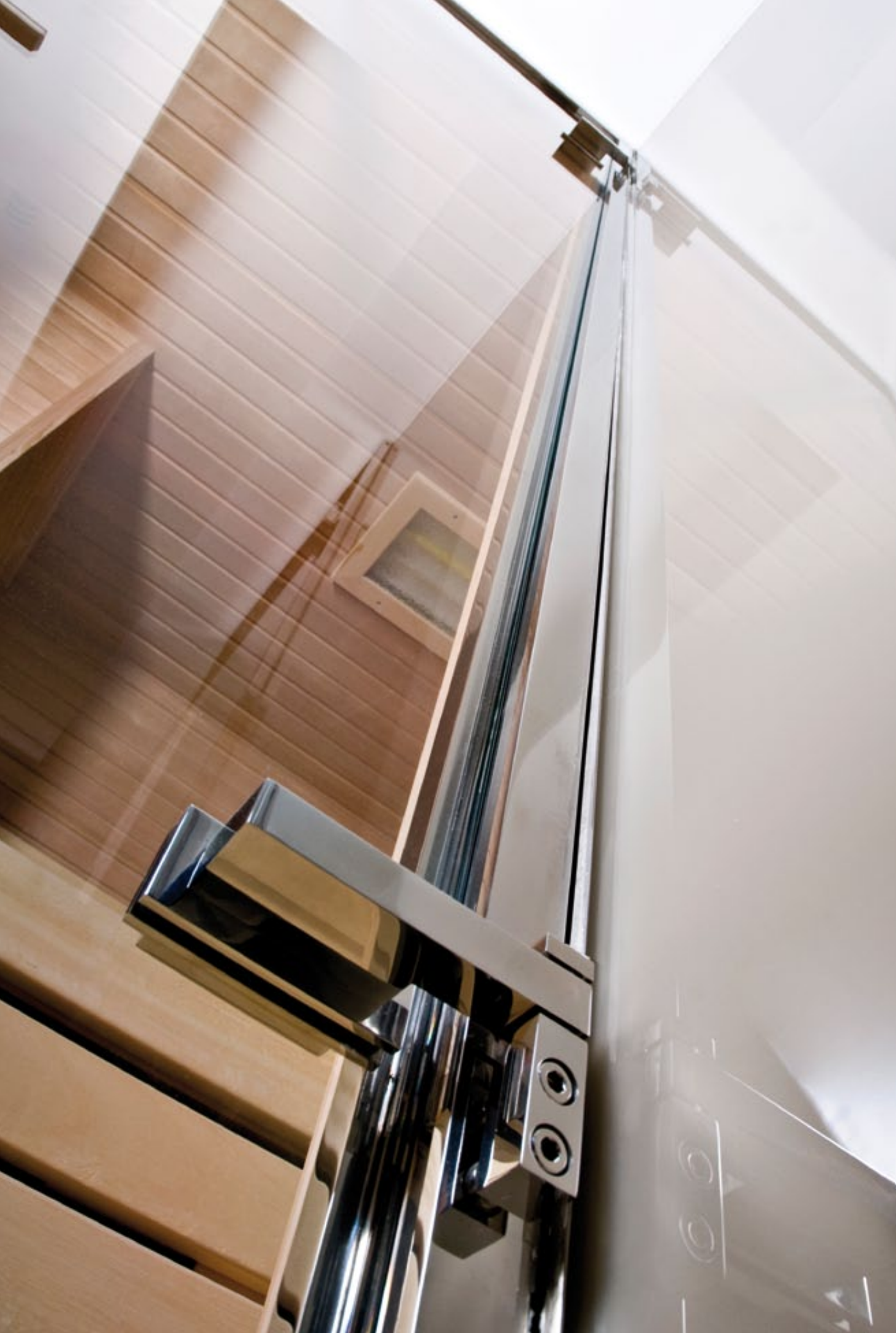
Duschsystem Akzent EZ.8500/TB.8601