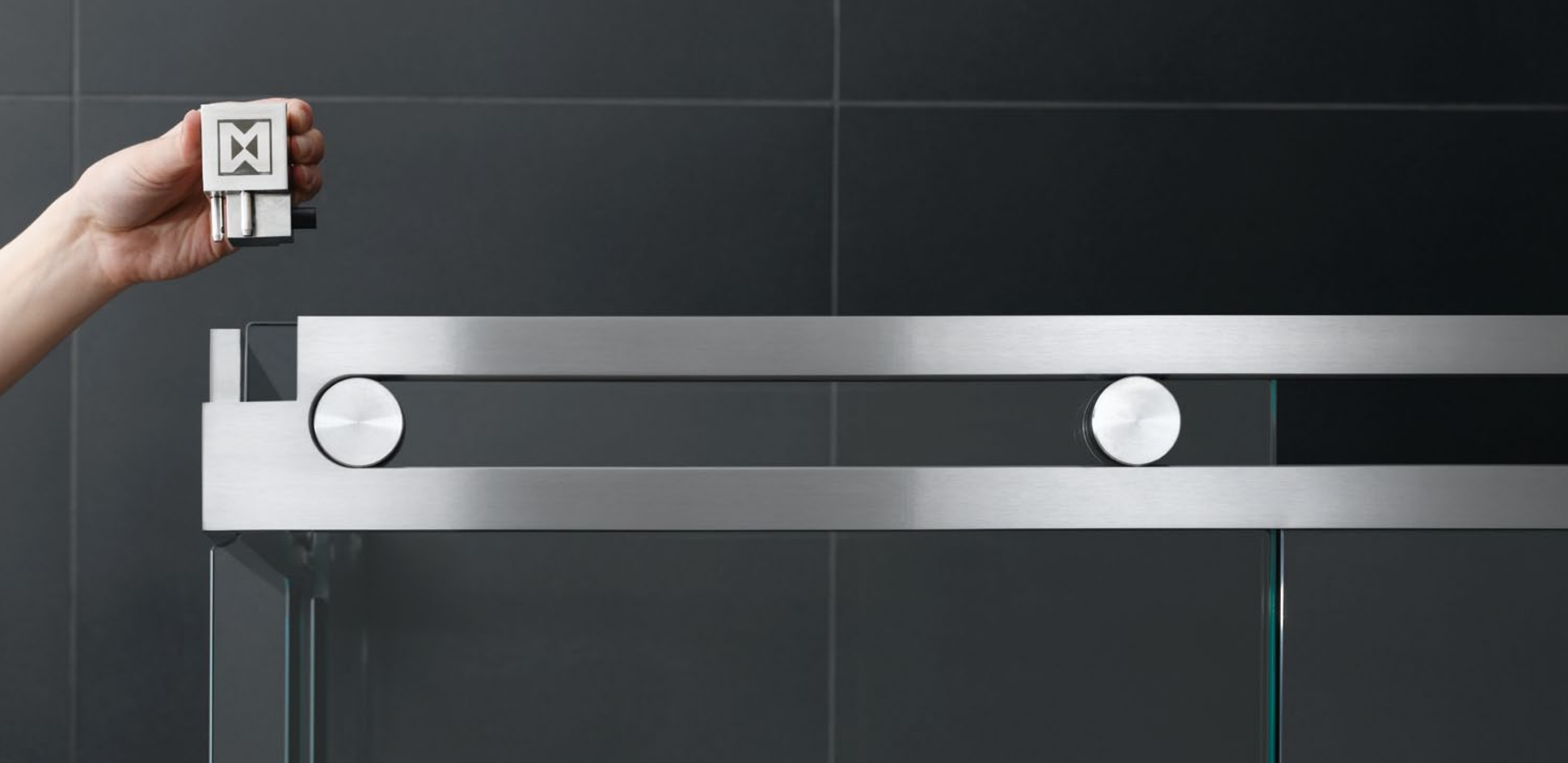
Duschesystem Luna DU.1019