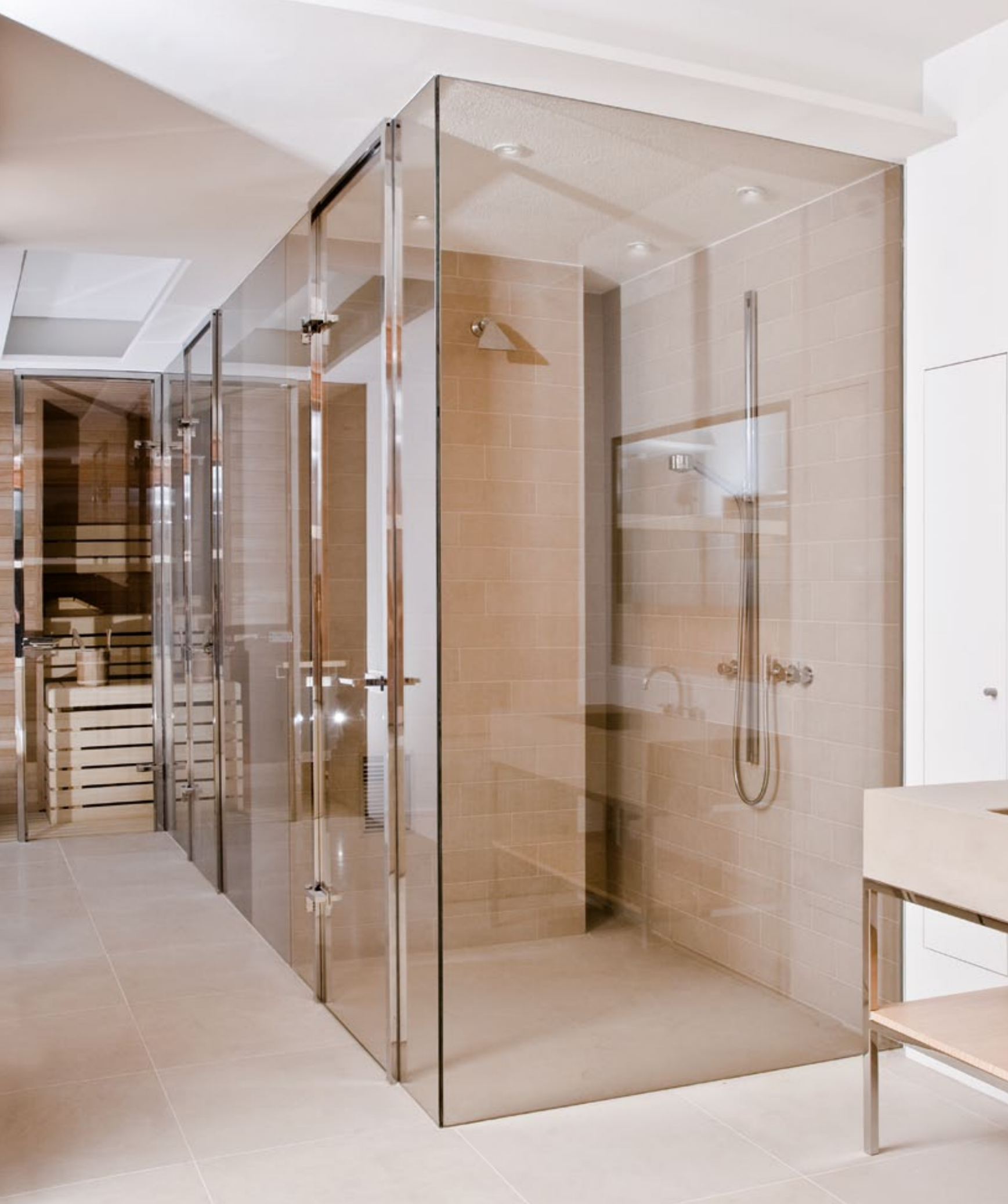
Duschsystem Akzent EZ.8500/TB.8601