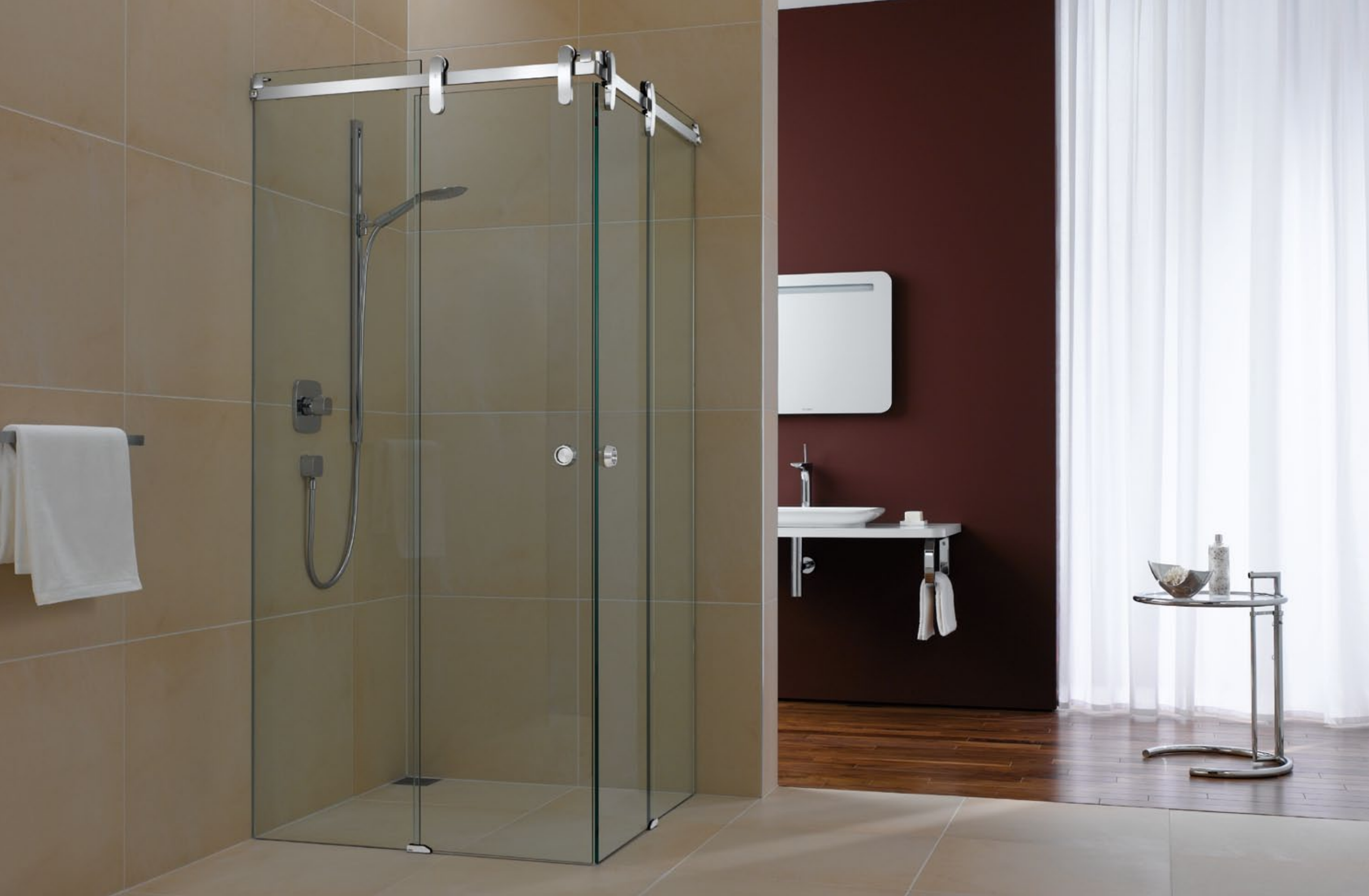
Duschsystem Prisma DU.1018