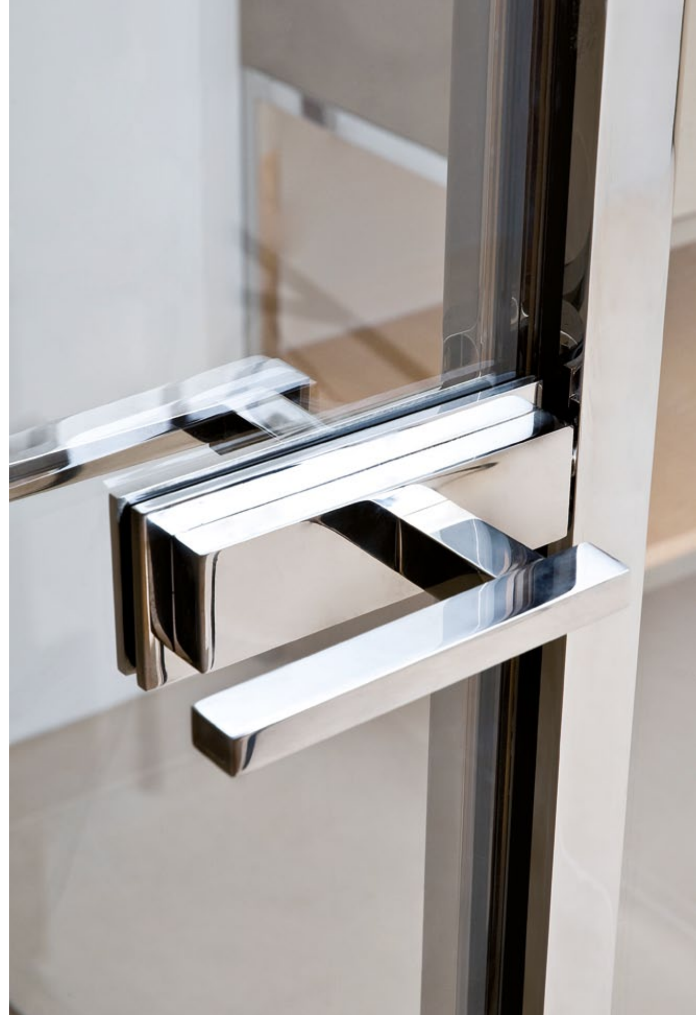
Duschsystem Akzent poliert, shower system Akzent polished