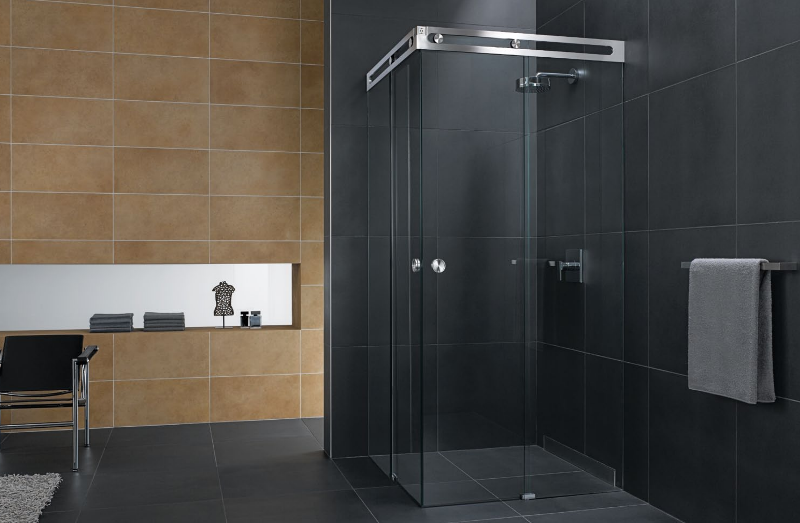
Duschsystem Luna DU.1019