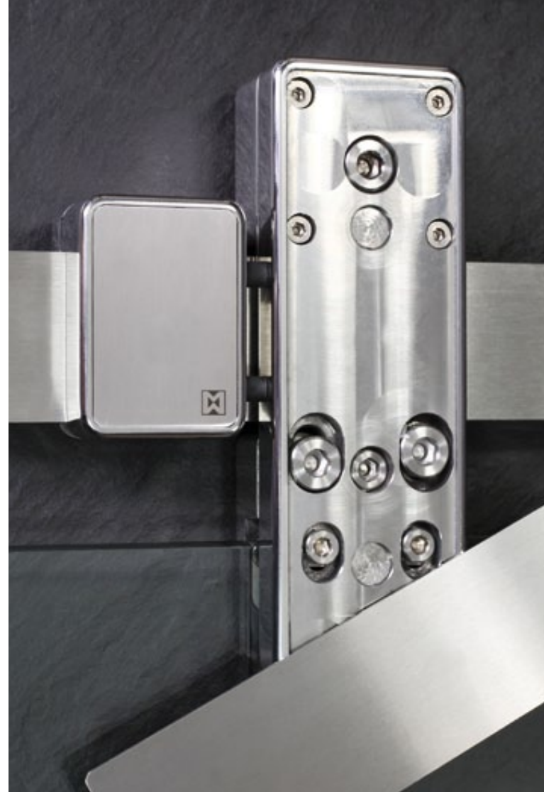
teilpoliert, stainless steel 600 grit/ stainless steel polished