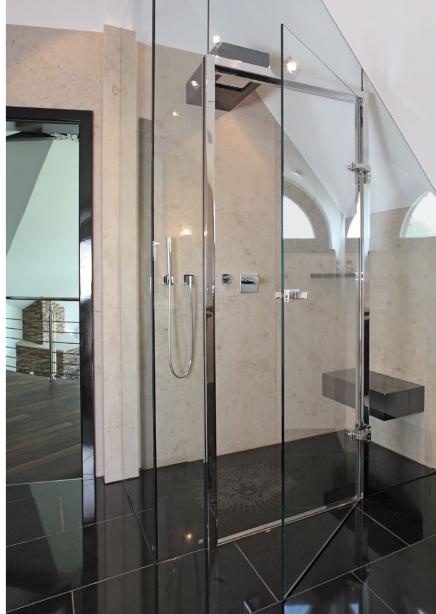
Duschsystem Akzent poliert, shower system Akzent polished