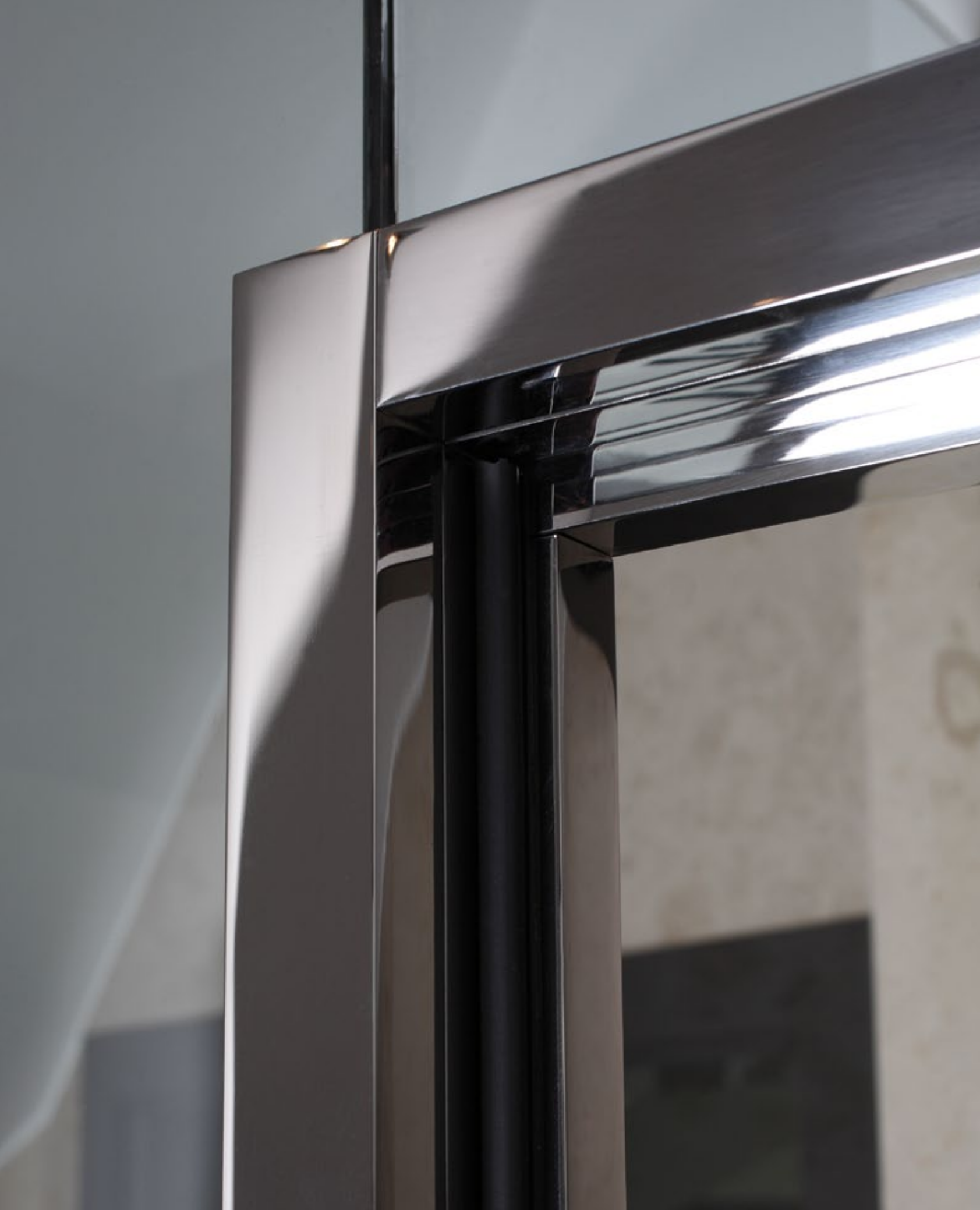
Duschsystem Akzent EZ.8500/TB.8601