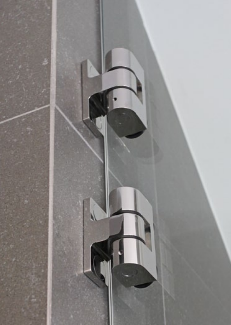
Türband poliert, door hinge polished