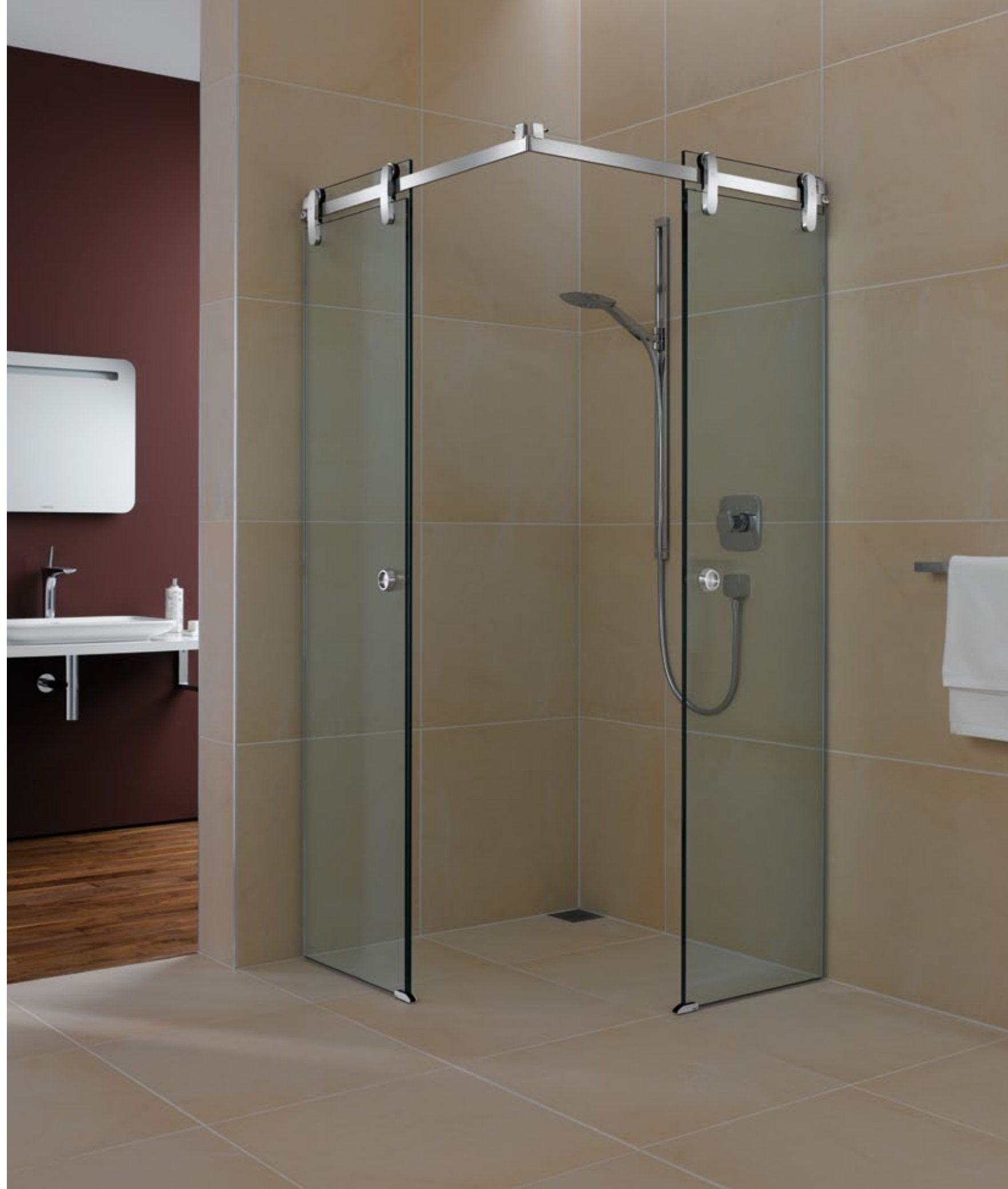
Duschsystem Prisma DU.1018