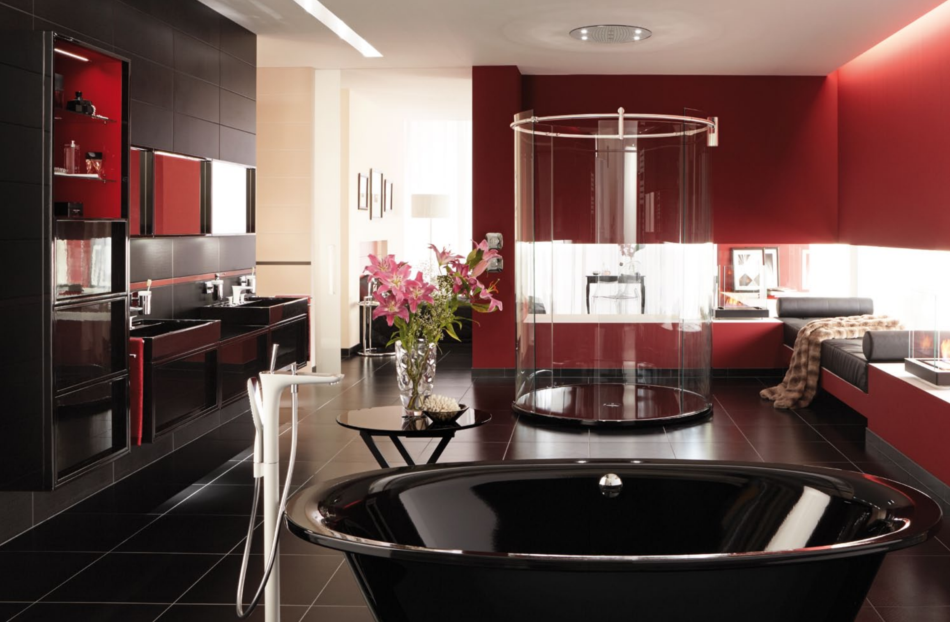
Runddusche Visio DU.1020.VS