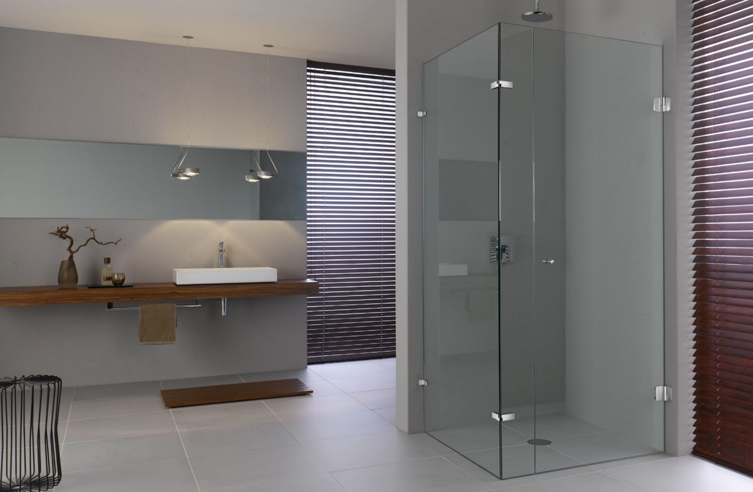
Duschesystem Spirit Wandanbindung DU.3345