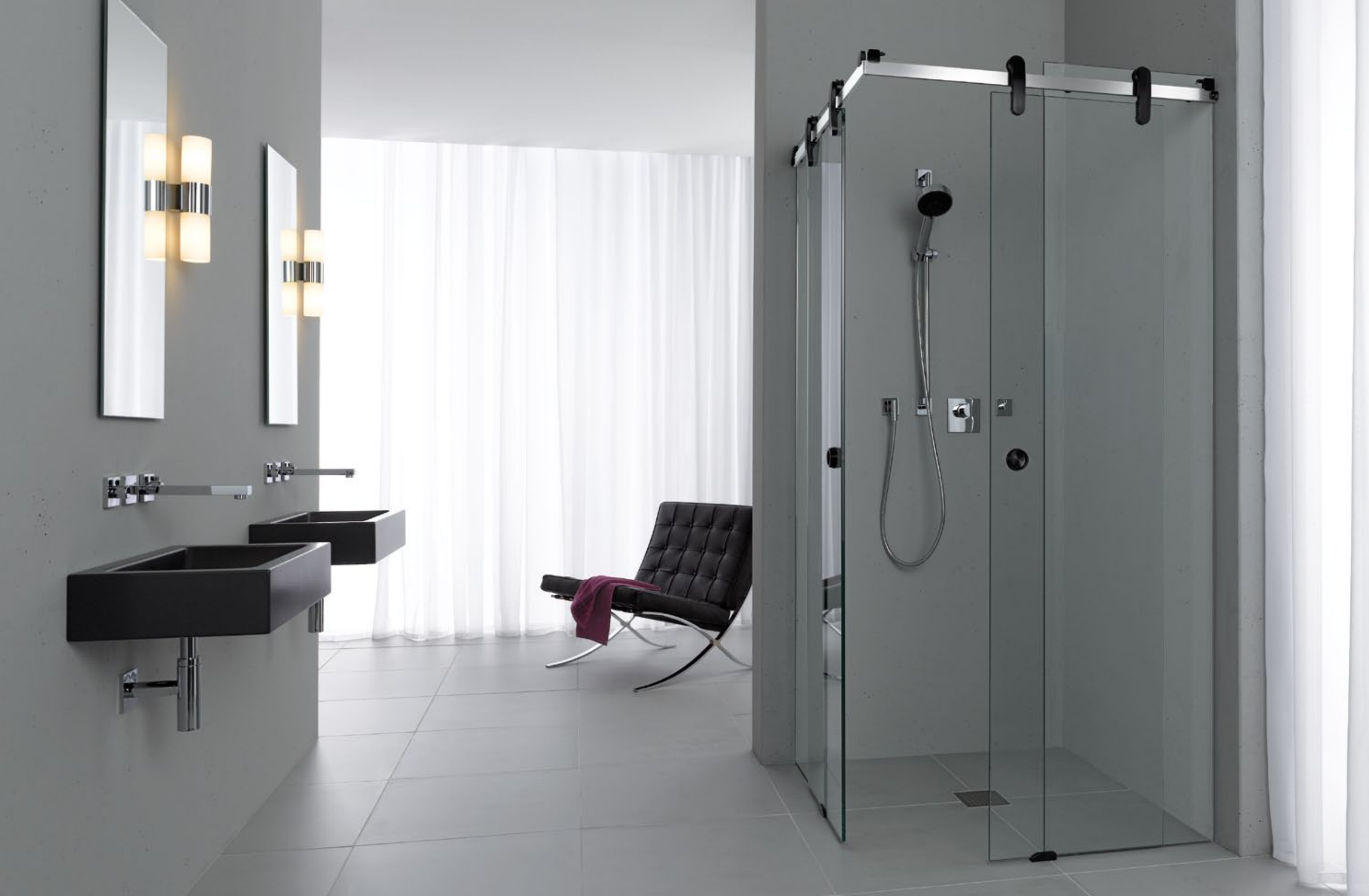
Duschesystem Prisma DU.1018 Colour edition