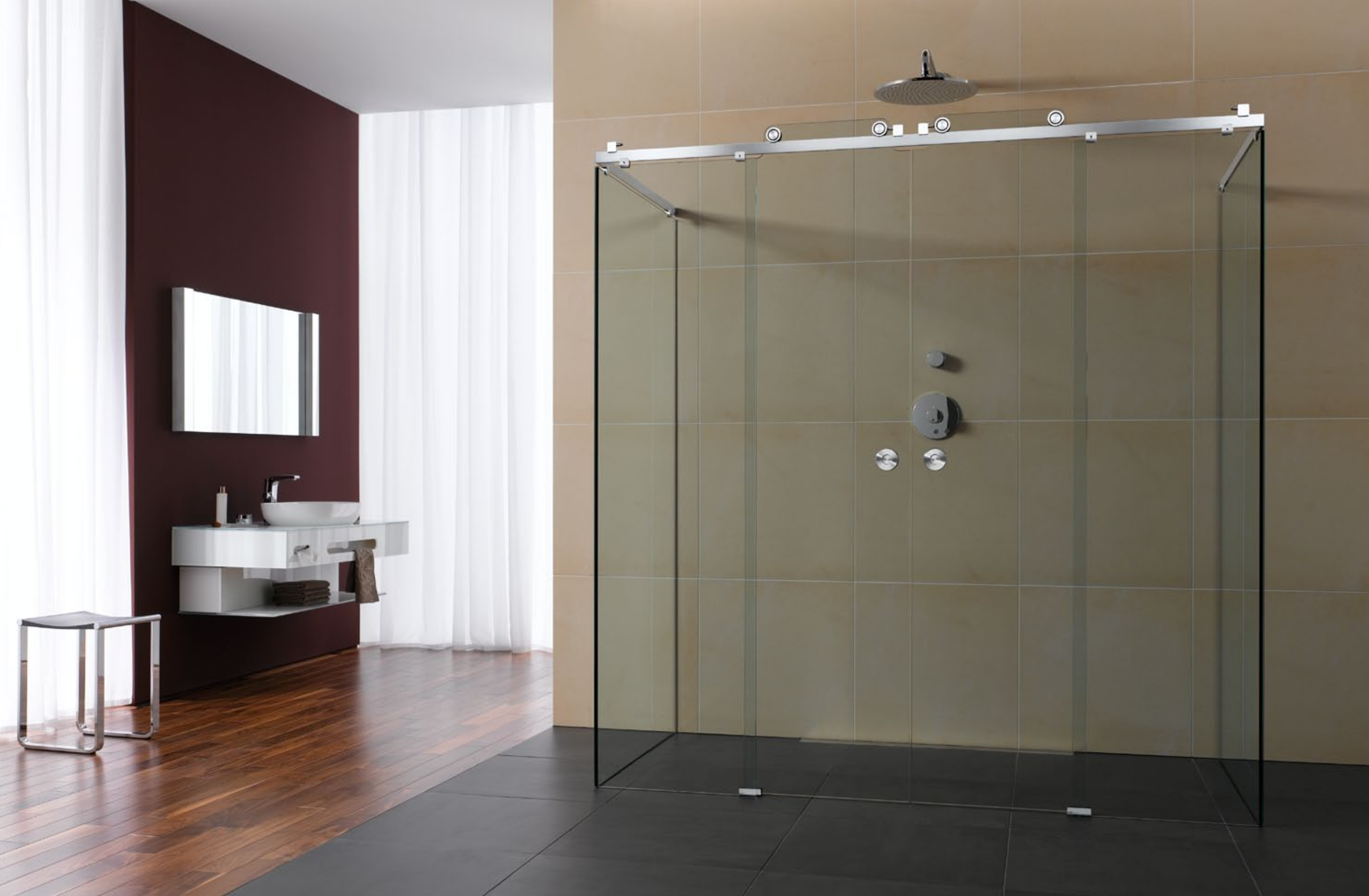
Duschsystem Claro DU.1014