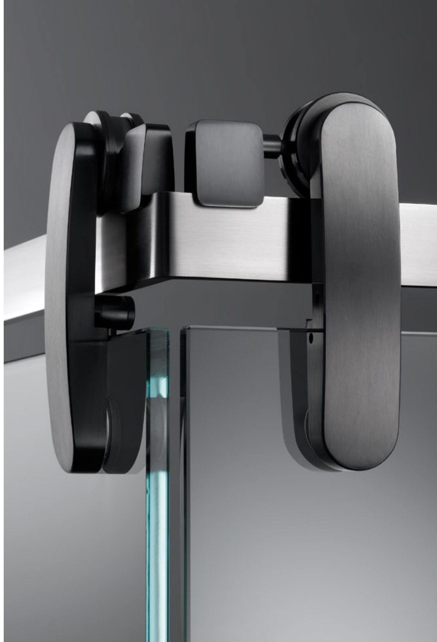
Duschsystem Prisma DU.1018 Colour edition