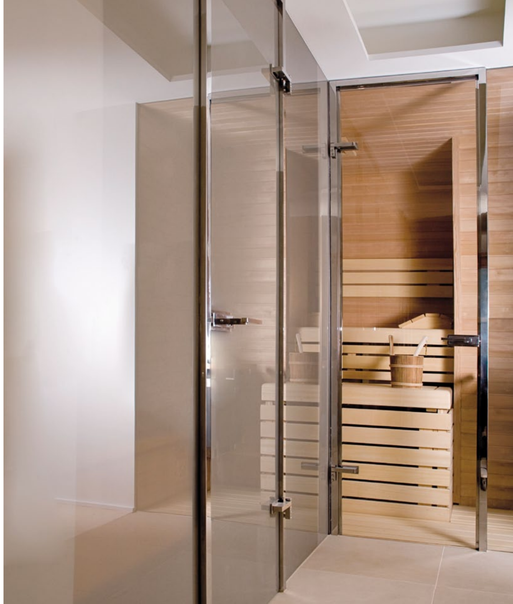
Duschsystem Akzent poliert, shower system Akzent polished