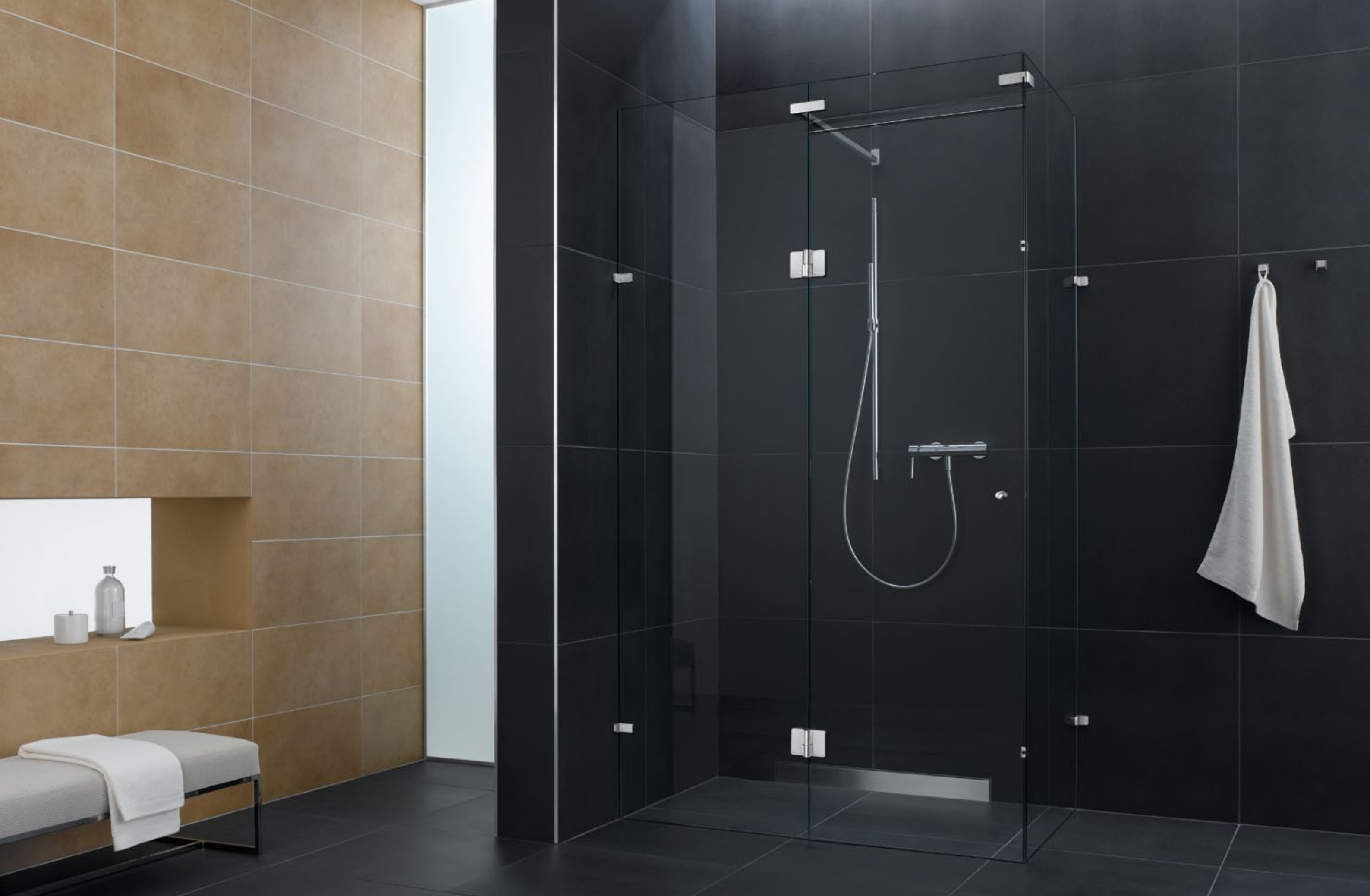
Duschsystem Spirit Glasanbindung DU.3340